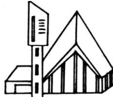
St. Paulus Künzelsau