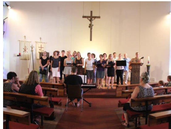
400 Jahre St.Jakobus Nagelsberg