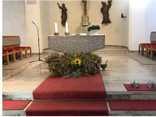
Kräuterbüschelweihe Kupferzell