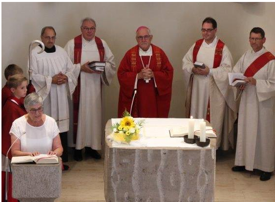
400 Jahre St.Jakobus Nagelsberg