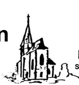
Mariä Geburt Amrichshausen