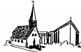
St. Jakobus Nagelsberg